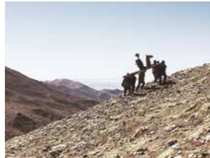
PIEDRA SOLA (Lonely Rock), de Alejandro Tarraf