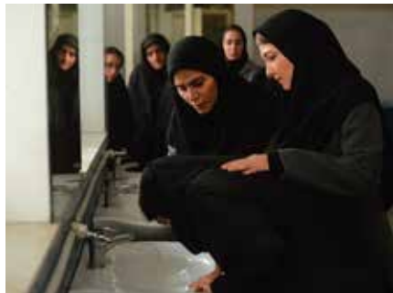
180° RULE (La regla de los 180°), de Farnoosh Samadi

Si eres mujer, romper las reglas en Irán tiene un precio y no necesariamente el del peso de la Ley. El filme de Farnoosh Samadi gira, como toda su filmografía, en torno a los secretos de sus protagonistas. Con 180° Rule, primer capítulo de una trilogía, se ha hecho con su tercer premio en la Seminci tras las dos Espigas de Oro que merecieron sus cortometrajes.