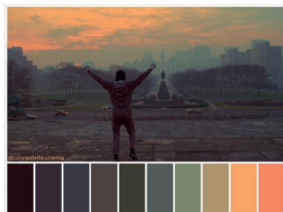
Rocky (John G. Avildsen, 1976). Paleta cromática de colorpalette.cinema .

Analiza los tonos predominantes: ¿qué emociones evocan? ¿Cómo se relacionan con el esfuerzo, el peligro o la esperanza?