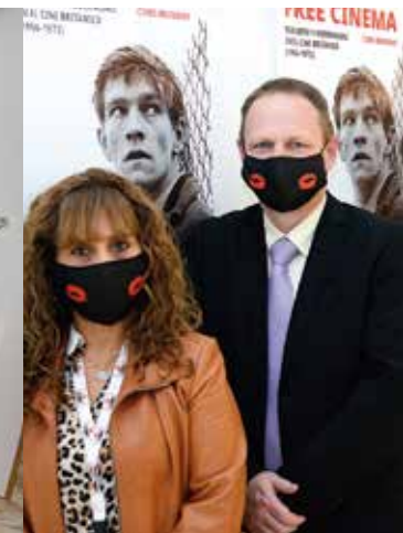
INTÉRPRETES: Carmen, Zhinz...