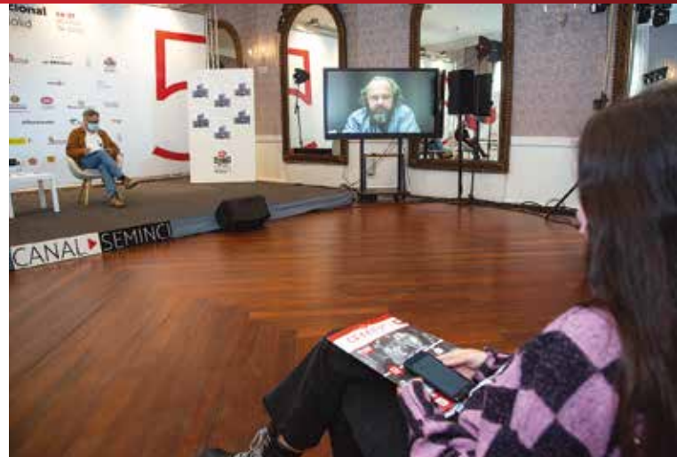
El director eslovaco Ivan Ostrochovský durante su comparecencia telemática