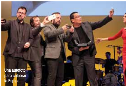
Una autofoto para celebrar la Espiga