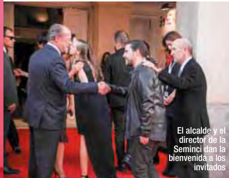
El alcalde y el director de la Seminci dan la bienvenida a los invitados