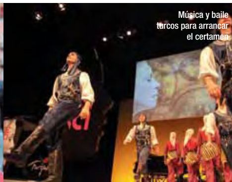
Música y baile turcos para arrancar el certamen