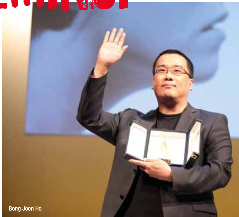
Bong Joon Ho

La entrega de las Espigas de Oro de Honor a Verónica Forqué y a Bong Joon Ho marcó el desarrollo de una gala de inauguración con potente sabor turco conducida por Ana Morgade y en la que Belén Rueda ejerció como madrina del Festival.