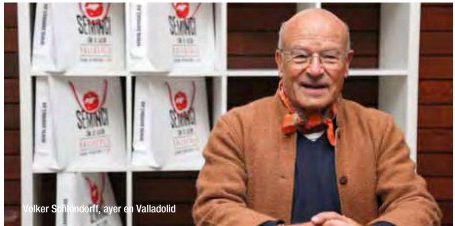
Volker Schlöndorff, ayer en Valladolid

El cineasta Volker Schlöndorff pasó por Valladolid para presentar ayer su última película, Diplomatie (Diplomacia) . El oscurizado artífice de El tambor de hojalata ha mostrado sus reticencias a emprender un segundo largometraje con la II Guerra Mundial como telón de fondo, pero finalmente ha admitido su “implicación natural con París” y se ha declarado “un hijo de la reconciliación”.