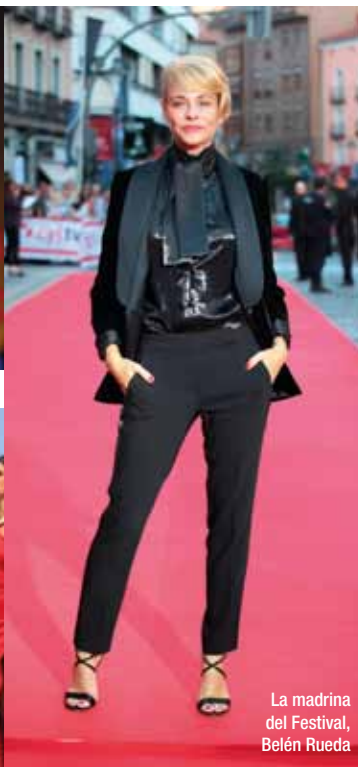
La madrina del Festival, Belén Rueda