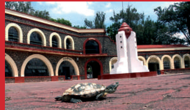
Ayotzinapa, el paso de la tortuga