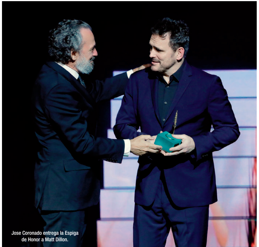
Jose Coronado entrega la Espiga de Honor a Matt Dillon.