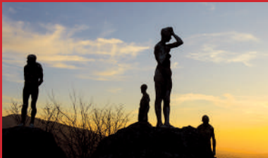
El silencio de otros