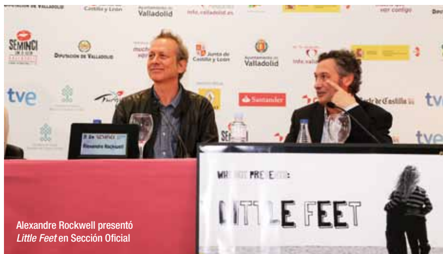
Alexandre Rockwell presentó Little Feet en Sección Oficial

El director Alexandre Rockwell, artífice de In the Soap y Somebody to Love , además de uno de los segmentos de la cinta de episodios Four Rooms ; presentó ayer en la 59ª Seminci su película Little Feet