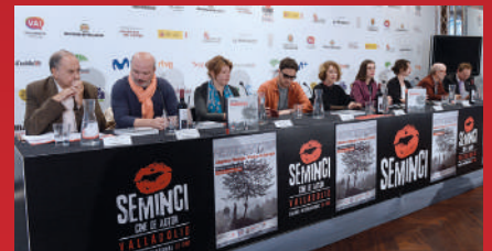
Participantes en la mesa redonda del país invitado

LA INDUSTRIA GEORGIANA: EJEMPLO DEL RESURGIR DEL CINE DE AUTOR IMPULSADO POR LAS INSTITUCIONES