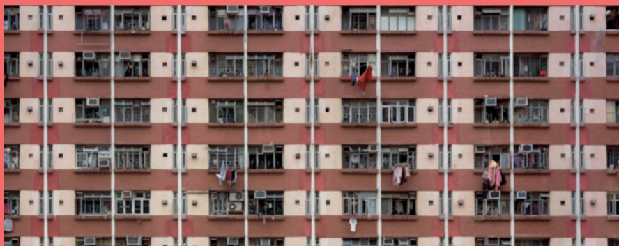
Architecture of Density (Hong Kong, 2003-2014), Michael Wolf.